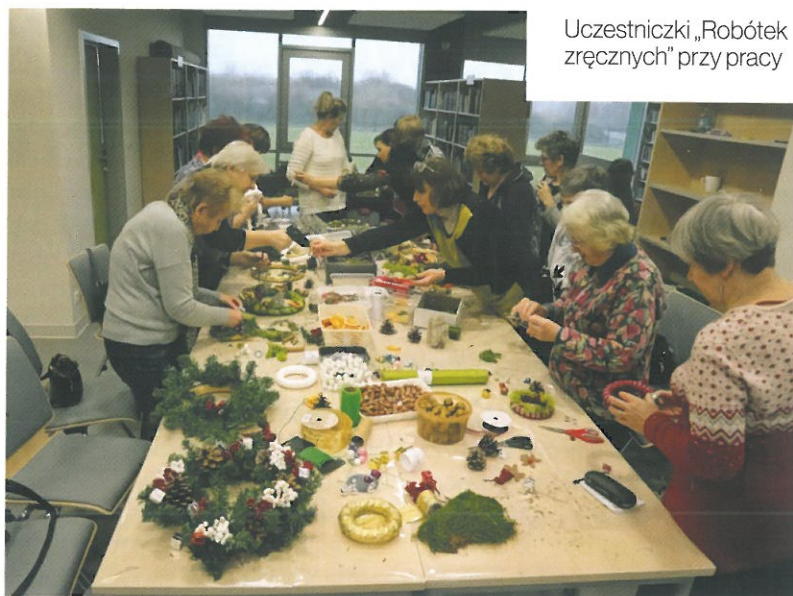
Uczestniczki „Robótek zręcznych” przy pracy

Przy organizacji takiej inicjatywy trzeba pamiętać o stworzeniu regulaminu, w którym zawarta będzie zgoda na uczestnictwo w akcji, akceptacja jego warunków oraz wyrażona zgoda na wykorzystanie danych osobowych