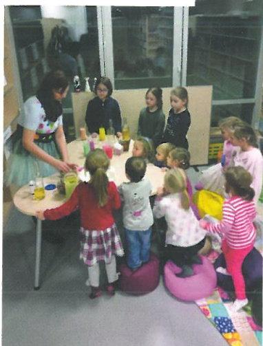
Pani Kropeczka i biblioteczne laboratorium

biblioteki zagościła akcja „Pani Kropeczka zaprasza na zajęcia literacko-plastyczne z cyklu «Bibliosłówka»”. Podczas pierwszych zajęć dzieci poznawały różne bajkowe postaci. Relację z nich można obejrzeć na stronie internetowej biblioteki pod adresem: https://biblioteka-stare-babice.pl/aktualnosci/pierwsze-zajecia-literacko-plastyczne-poznaj-pania-kropeczke-za-nami .