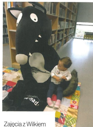
Zajęcia z Wilkiem