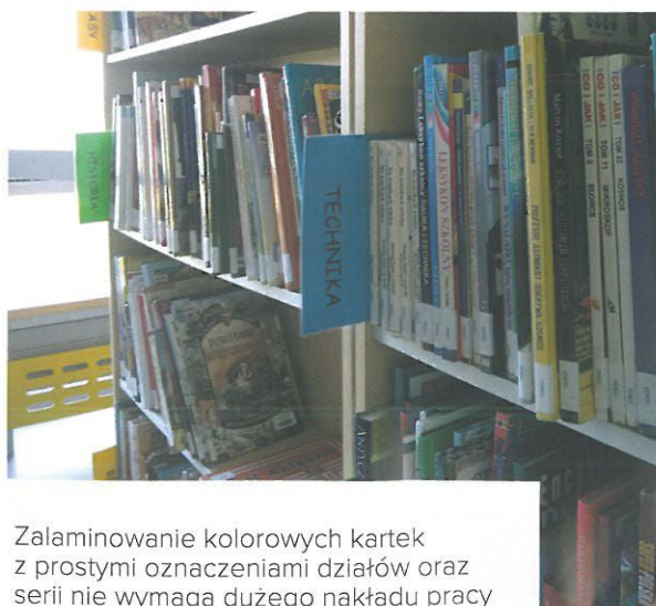
Zalaminowanie kolorowych kartek z prostymi oznaczeniami działów oraz serii nie wymaga dużego nakładu pracy

W naszej przystani, gdzie króluje słowo drukowane, nie zapominamy również o dorosłych czytelnikach. Chciałam, aby strefa dla dorosłego użytkownika biblioteki była łatwa w użytkowaniu i dobrze się prezentowała. Funkcjonalność jest priorytetem, ale nie zapomnijmy również o czynnikach estetycznych. Nasze logo, które jest bardzo żywe i kolorowe, stało się wyznacznikiem organizacji przestrzeni dla dzieci i młodzieży. Przy doborze kolorystyki w części dla dorosłych brałam pod uwagę