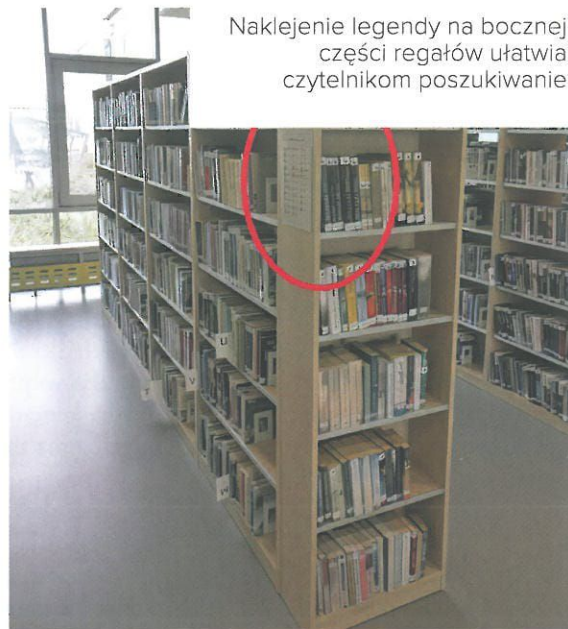
Naklejenie legendy na bocznej części regałów ułatwia czytelnikom poszukiwanie