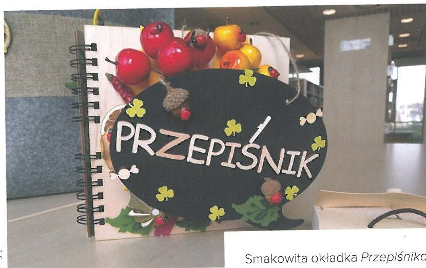
Smakowita okładka Przepisnika

Tym razem chciałam połączyć bajkę i podróż, i jeszcze trochę